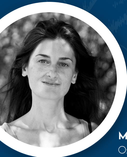
MAIA KUBIS Organisation & Anmeldung

Das Retreat orientiert sich an der Lehre von „Ein Kurs in Wundern“ und dessen Grundidee: „Nichts Wirkliches kann bedroht werden. Nichts Unwirkliches existiert.“ Dies wollen wir gemeinsam in die Erfahrung bringen und in unser Leben integrieren.